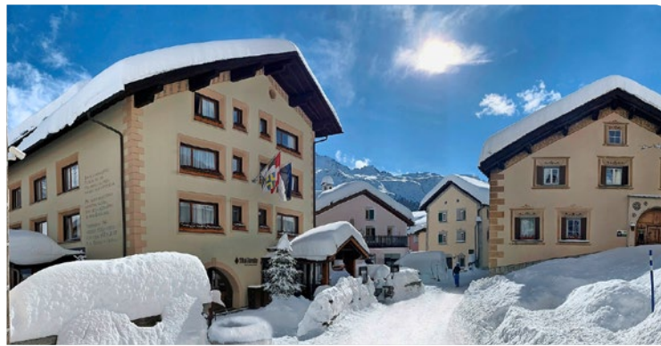
Zentral gelegen und doch gleich in der Natur: Das Hotel Albana (links).

Die auch in den tieferen Preisklassen geräumigen, modernen und mit viel Arvenholz eingerichteten Zimmer, teils mit Kamin, Badewanne und Küche, verströmen eine heimelige Wohnzimmer-Atmosphäre und laden mit dem traumhaften Ausblick auf die Berge zum längeren Verweilen ein. Die meisten Zimmer sind nach Südosten ausgerichtet, womit auch der Silvaplannersee zu sehen ist. Dieser befindet sich übrigens nur wenige Gehminuten vom sehr zentral gelegenen Al-